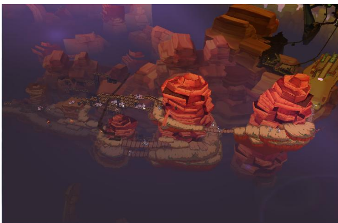
2. Besma - Canyon di Toritugera (vecchio)