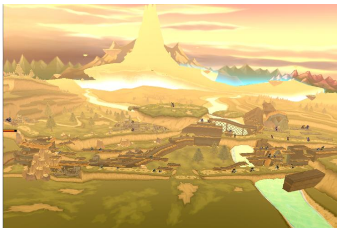
4. Altera - Tomba della Purificazione